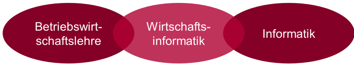
Abb. 1: Wirtschaftsinformatik als eigenständiges und interdisziplinäres Fach

„Die Wirtschaftsinformatik ist eine eigenständige, interdisziplinäre Wissenschaft. Sie hat ihre Wurzeln in der Informatik und den Wirtschaftswissenschaften, insbesondere der Betriebswirtschaftslehre. Die Wirtschaftsinformatik lässt sich als Realwissenschaft klassifizieren, da Phänomene der Wirklichkeit untersucht werden. Sie trägt dabei insbesondere Wesenszüge einer Ingenieurwissenschaft, da die Gestaltung von Informationssystemen eine Konstruktionssystematik verlangt. Ebenso hat die Wirtschaftsinformatik Bezüge zu den Verhaltenswissenschaften, da diese Theorien und Methoden zur Analyse der sozialen Wirklichkeit bereitstellen. Die Wirtschaftsinformatik beinhaltet auch Elemente einer Formalwissenschaft, da die Analyse und Gestaltung von Informationssystemen der Entwicklung und Anwendung formaler Beschreibungsverfahren bedürfen. Die Wirtschaftsinformatik wird nicht von einer einzelnen Theorie, Methode oder Perspektive dominiert. Eine enge Verzahnung mit der Praxis, zum Zwecke der Gewinnung und Validierung von Erkenntnissen, ist dabei wünschenswert und notwendig.“ [8]